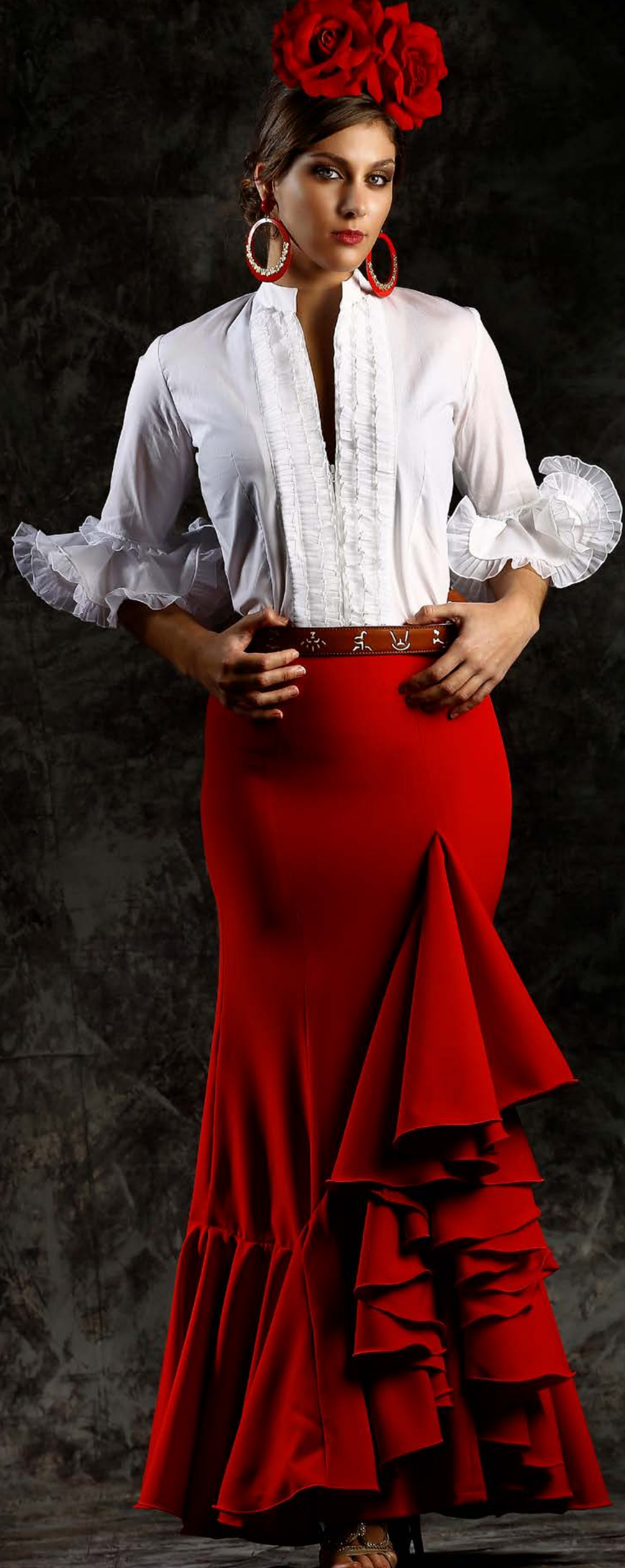
BLUSA REBECA - FALDA SALINA